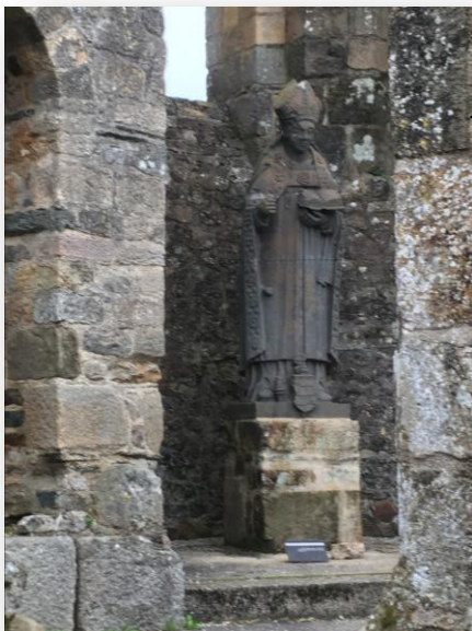
Statue de Saint Gwénoùlé

« L'histoire de l'Abbaye est stupéfiante. Avant qu'elle ne soit détruite, elle était améliorée chaque jour » (Gabriel E)