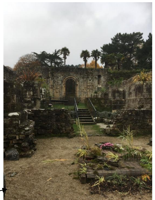
Emplacement de l'ancienne église

« J'ai appris que les feuilles sur lesquelles on écrivait, étaient en peau d'animaux » ( Antoine S)