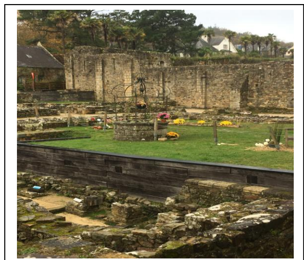
Ancienne cour carolingienne